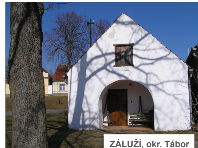
ZÁLUŽÍ, okr. Tábor (Zděná kovárna)

Lidová architektura a památky České republiky © Martin Čerňanský, info@lidova-architektura.cz