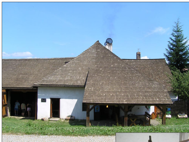
NOVÉ HRADY, o. Č. Budějovice (Kovárna z počátku 18. století)