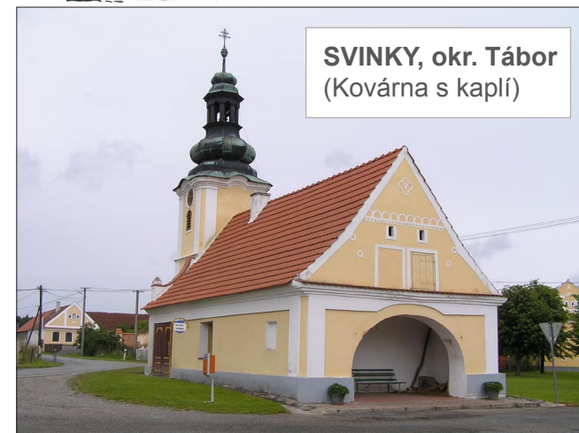
SVINKY, okr. Tábor (Kovárna s kaplí)