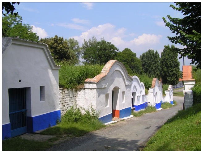
PETROV - PLŽE, okr. Hodonín (Soubor vinných sklepů)