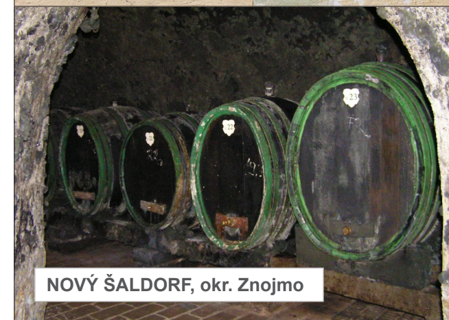
NOVÝ ŠALDORF, okr. Znojmo