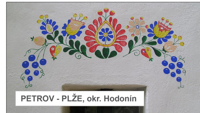
PETROV - PLŽE, okr. Hodonín