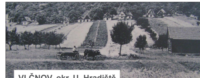
VLČNOV, okr. U. Hradiště

Mezi vinohradnické stavby řadíme též drobné přístřešky, kříže a kapličky stojící ve vinohradech. Specifickou formou je tzv. vinohradnický dům .