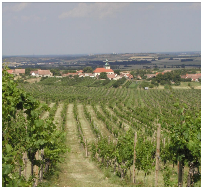
HAVRANÍKY, okr. Znojmo (Viniční tratě)