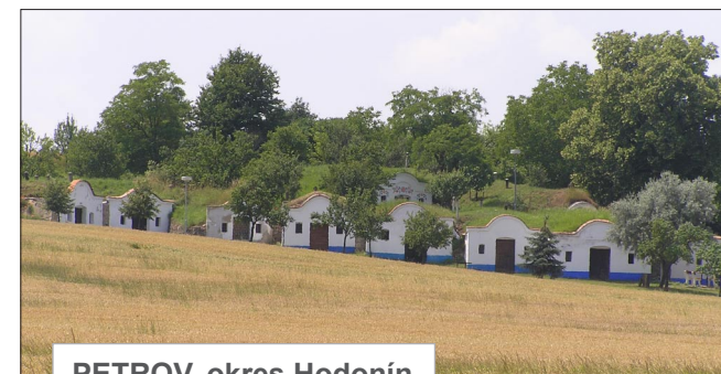
PETROV, okres Hodonín