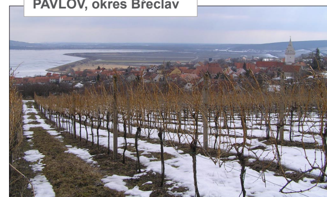
PAVLOV, okres Břeclav

Lidová architektura a památky České republiky © Martin Čerňanský, info@lidova-architektura.cz