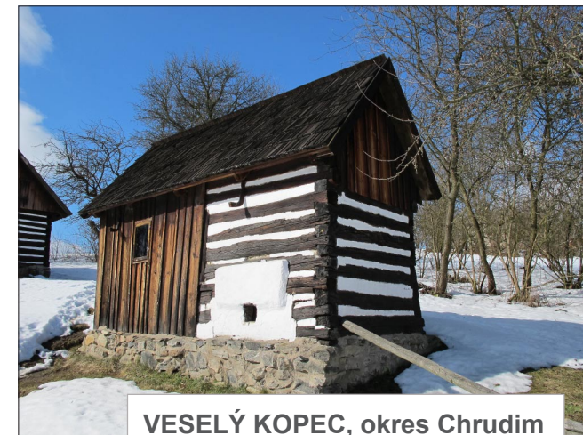
VESELÝ KOPEC, okres Chrudim (Roubená sušárna ze Stříteže)

Lidová architektura a památky České republiky © Martin Čerňanský, info@lidova-architektura.cz