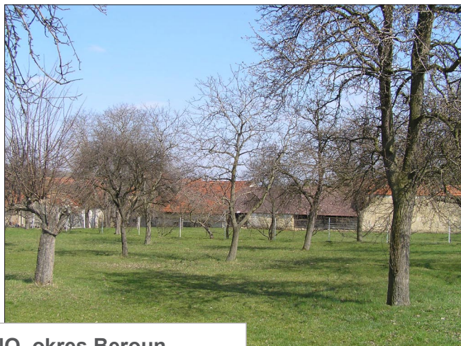
KORNO, okres Beroun (Ovocné zahrady za stodolami)