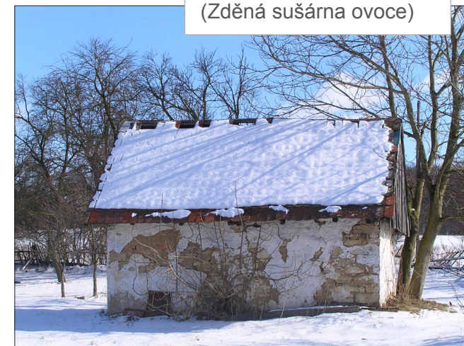
LIBEŇ, okres H. Králové (Zděná sušárna ovoce)