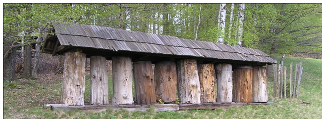
ROŽNOV POD RADHOŠTĚM (Klátové úly ze špalků)