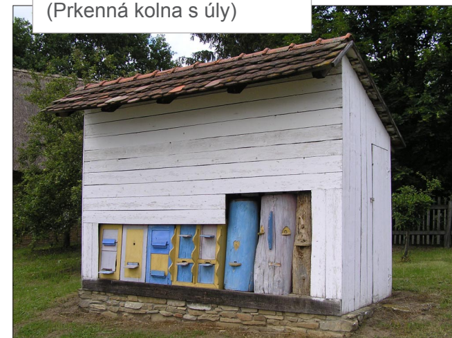
STRÁŽNICE, okr. Hodonín (Prkenná kolna s úly)

Lidová architektura a památky České republiky © Martin Čerňanský, info@lidova-architektura.cz