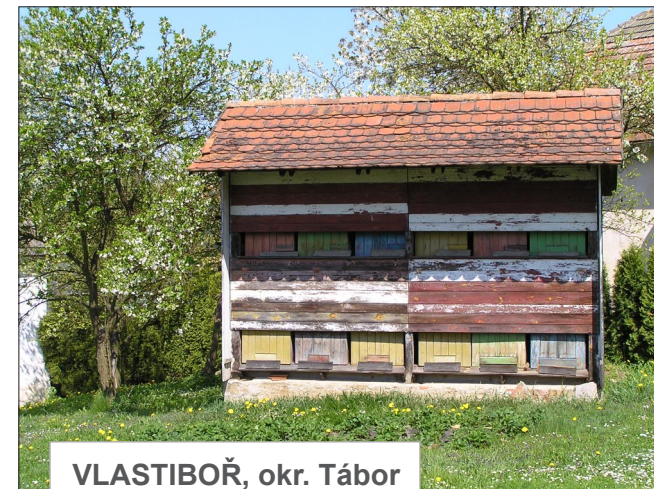
VLASTIBOŘ, okr. Tábor (Včelín na zahradě)

Mladší formou jsou rozběrné včelí úly z prken. Jsou obvykle soustředěny do kolen s úly (včelínů) .