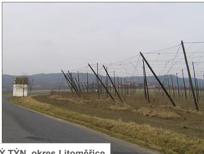
STARÝ TÝN, okres Litoměřice (Chmelnice na Úštěcku)

LIDOVÁ ARCHITEKTURA www.lidova-architektura.cz