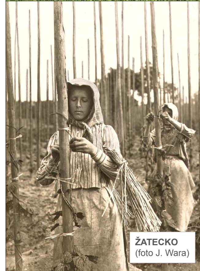
ŽATECKO (foto J. Wara)

Lidová architektura a památky České republiky © Martin Čerňanský, info@lidova-architektura.cz