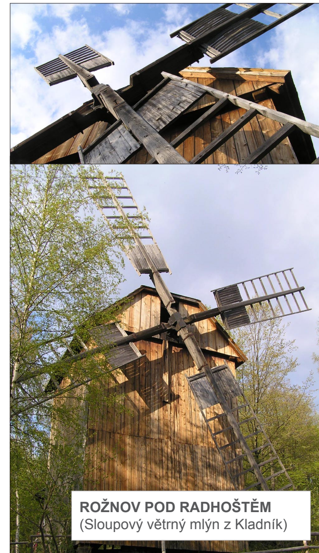
ROŽNOV POD RADHOŠTĚM (Sloupový větrný mlýn z Kladník)

Lidová architektura a památky České republiky © Martin Čerňanský, info@lidova-architektura.cz