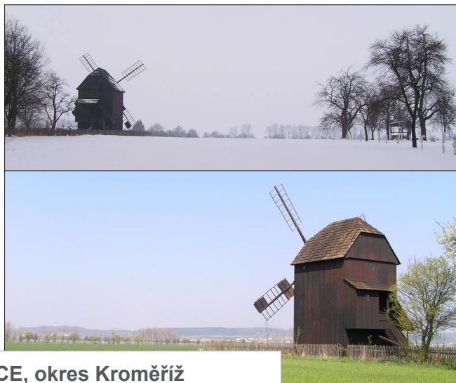
RYMICE, okres Kroměříž (Dřevěný větrný mlýn z Bořenovic)

Zpět na stránky www.lidova-architektura.cz