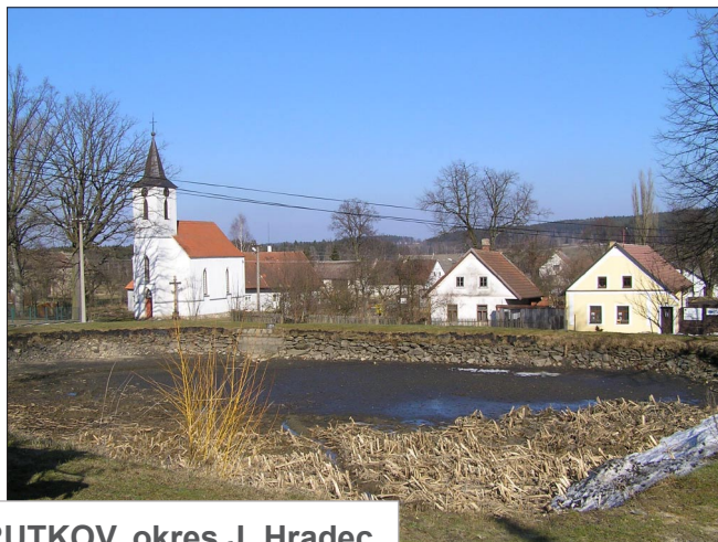
HRUTKOV, okres J. Hradec (Náves s rybníky, SK 1841)

LIDOVÁ ARCHITEKTURA www.lidova-architektura.cz