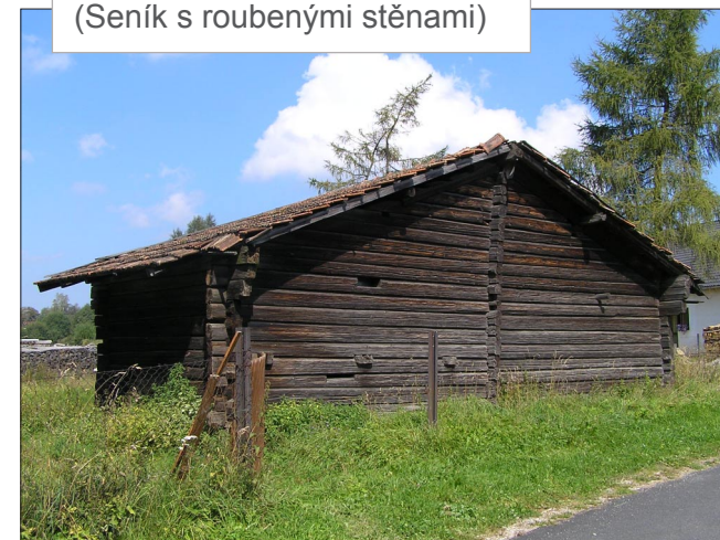
VOLARY, okr. Prachatice (Seník s roubenými stěnami)

Lidová architektura a památky České republiky © Martin Čerňanský, info@lidova-architektura.cz