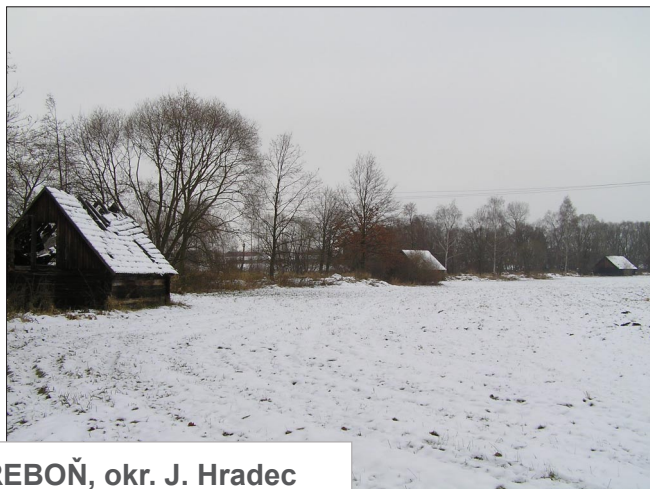
TŘEBOŇ, okr. J. Hradec (Roubené seníky na lukách)

LIDOVÁ ARCHITEKTURA www.lidova-architektura.cz