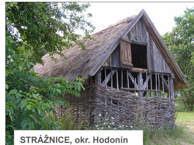
STRÁŽNICE, okr. Hodonín (Seník s vypletanými stěnami)

Z důvodu zemní vlhkosti a ochrany sena před záplavami jsou postaveny na kameny . Valbové nebo sedlové střechy kryjí došky, šindele či tašky.